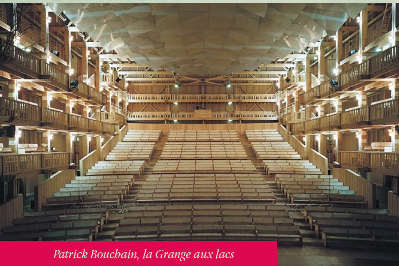
Patrick Bouchain, la Grange aux lacs